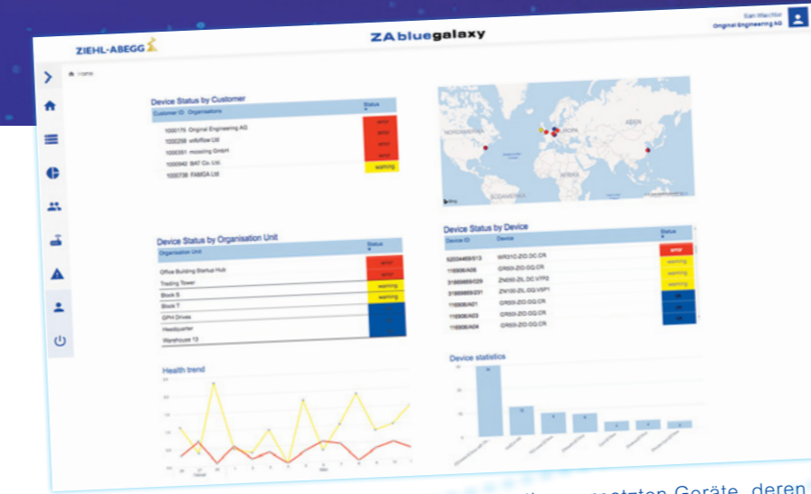
Mit nur einem Klick haben Sie Überblick auf alle Ihre vernetzten Geräte, deren Zustand und Prozesse, ganz bequem und übersichtlich von jedem Ort der Welt.

Mit Hochsicherheits-Datenräumen, speziell für neue unternehmerische Bestleistungen, perfekte Produktnutzung, mit vorausschauender Wartung für noch effizientere Ergebnisse, neue Ressourcen, zufriedene Kunden und mehr Unternehmensgewinn in den Bereichen Lufttechnik, Regeltechnik und Antriebstechnik jeder Branche.